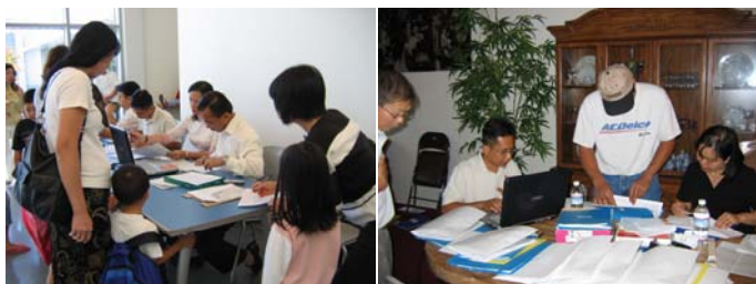
Ghi danh HS tại trường

Kể từ cuối niên khóa 2005-2006, TVNVL đã tổ chức ghi danh cho học sinh cho niên học 06-07. Sau đó trong mùa hè qua, nhà trường cũng đã thông báo trên báo chí về việc ghi danh trước của học sinh cho niên học 2006-2007. Công việc này đã giúp cho Khối Điều hành và Khối Học vụ dễ dàng hơn trong việc sắp xếp lớp học hoàn tất trước ngày khai giảng niên học. Sau ngày khai giảng niên học 2006-07, nhà trường đã tiếp tục ghi danh học sinh cho các lớp học còn chỗ trống trong các ngày 17 và 24/9/2007. Tính đến ngày 24/9/2006 có tất cả là 490 học sinh ghi danh theo học Việt ngữ tại 20 lớp học của TVNVL.