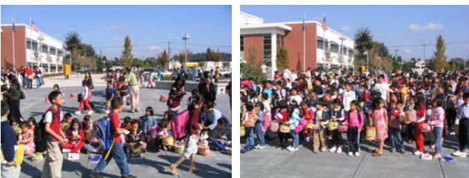
Mừng Tết Trung Thu 2005

Ngày 1/10/06 nhà trường sẽ tổ chức mừng Tết Trung Thu 2006 cho các em học sinh TVNVL tại khuôn viên nhà trường. Các em học sinh sẽ được thầy cô giảng dạy cho biết về nguồn gốc và ý nghĩa của ngày Tết Trung Thu là ngày tết truyền thống của dân tộc dành cho các em thiếu nhi. Các em học sinh sẽ được phát bánh kẹo và tham gia các trò chơi sinh hoạt có giải thưởng