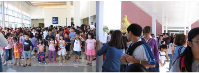
Ngày Khai Trường - Chuẩn bị vào lớp học

Niên khóa 2006-07 có tất cả là 20 lớp học từ cấp Mẫu giáo cho đến lớp 10. Các lớp học này gồm có: 4 lớp Mẫu giáo, 4 lớp Một, 3 lớp Hai, 2 lớp Ba, 2 lớp Bốn, 1 lớp Năm, 1 lớp Sáu, 1 lớp Bảy, 1 lớp Tám & 1 lớp Mười.